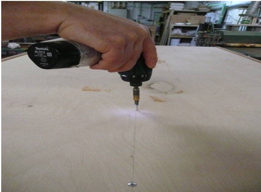
Rückwand einschieben / auf rechten Winkel prüfen mit Korpus verschrauben