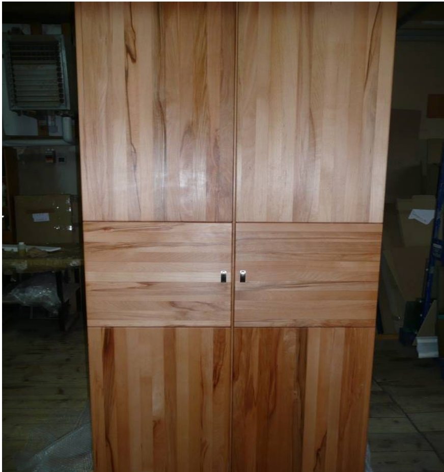
Glückwunsch / geschafft